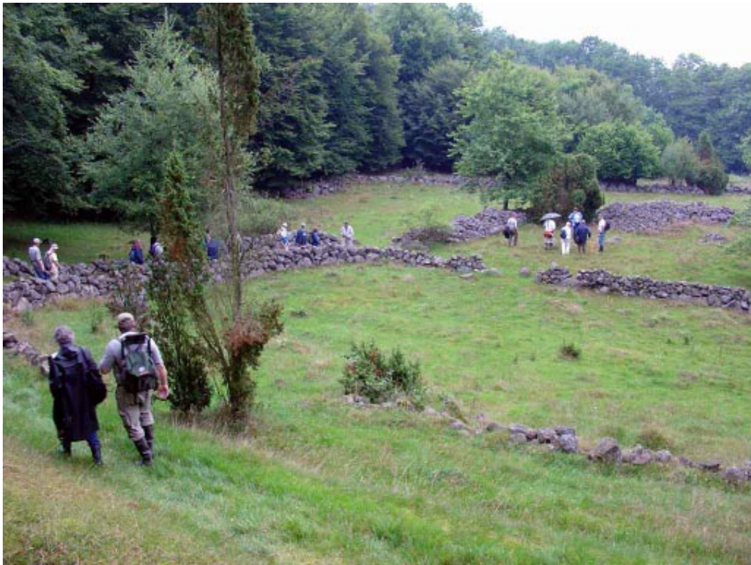
Vandring med Floravårdsgruppen i Rallatédalen