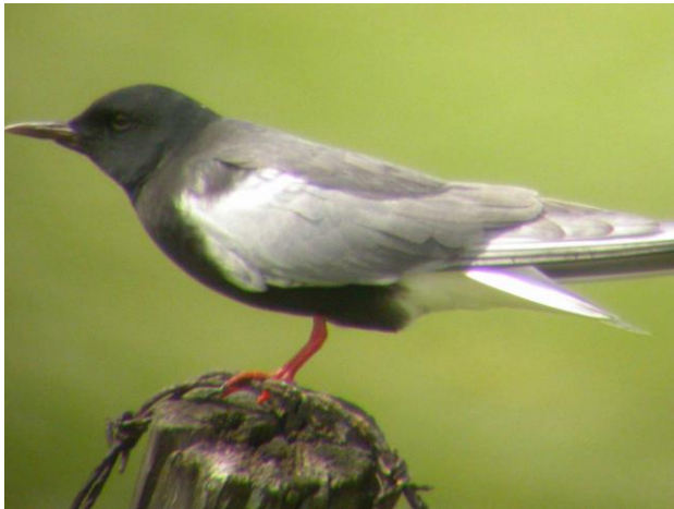
Vitvingad tärna i Biebrza

Nästa morgon flyttade vi oss ännu längre österut mot Bialowiescaskogen. Vi nådde orten Bialowiesca och guidades runt på det naturhistoriska muséet. Efter lunch besåg vi hägnet med visenter, tarpaner mm, där vi också hörde de första halsbandsflugsnapparna. Vi återvände till byn och promenerade ut genom palatsparken och in i det strikta reservatet. Här gick man i en skog som saknar motsvarighet i Sverige: Träden är högre och grövre, fältskiktet rikare och det är gott om t ex halsbandsflugsnappare och många olika hackspettar. Några av oss hade turen att se en vitryggig hackspett. Efter urskogsrundan fortsatte vi med buss till en plats där guiden kunde visa oss ett bo med häckande tretåig hackspett. Efter lite vila blev det sedan grillafton och allsång tillsammans med lokala ”agroturismtreprenörer”.