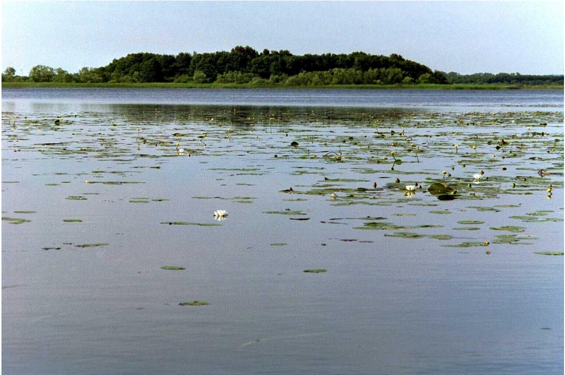
Kvinneholme - en spännande ö mitt i Hammarsjön