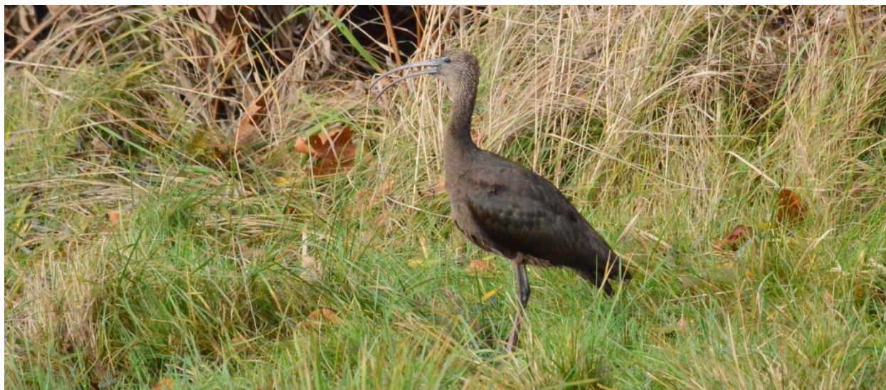
Ny art på Sländan: Bronsibis , Långebro 19 nov 2013