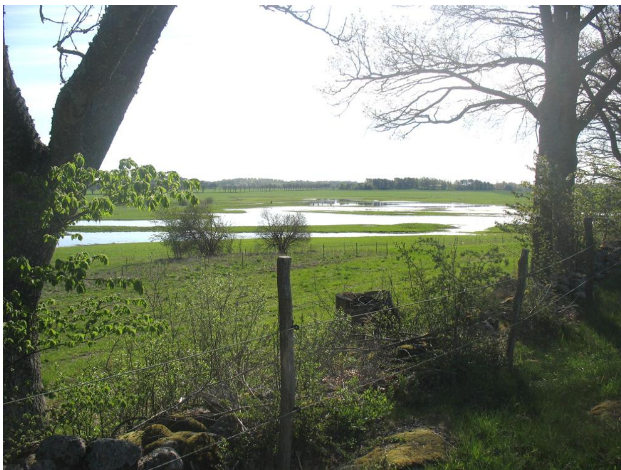
Den nya våtmarken vid Adinal, nordväst om Färlöv.