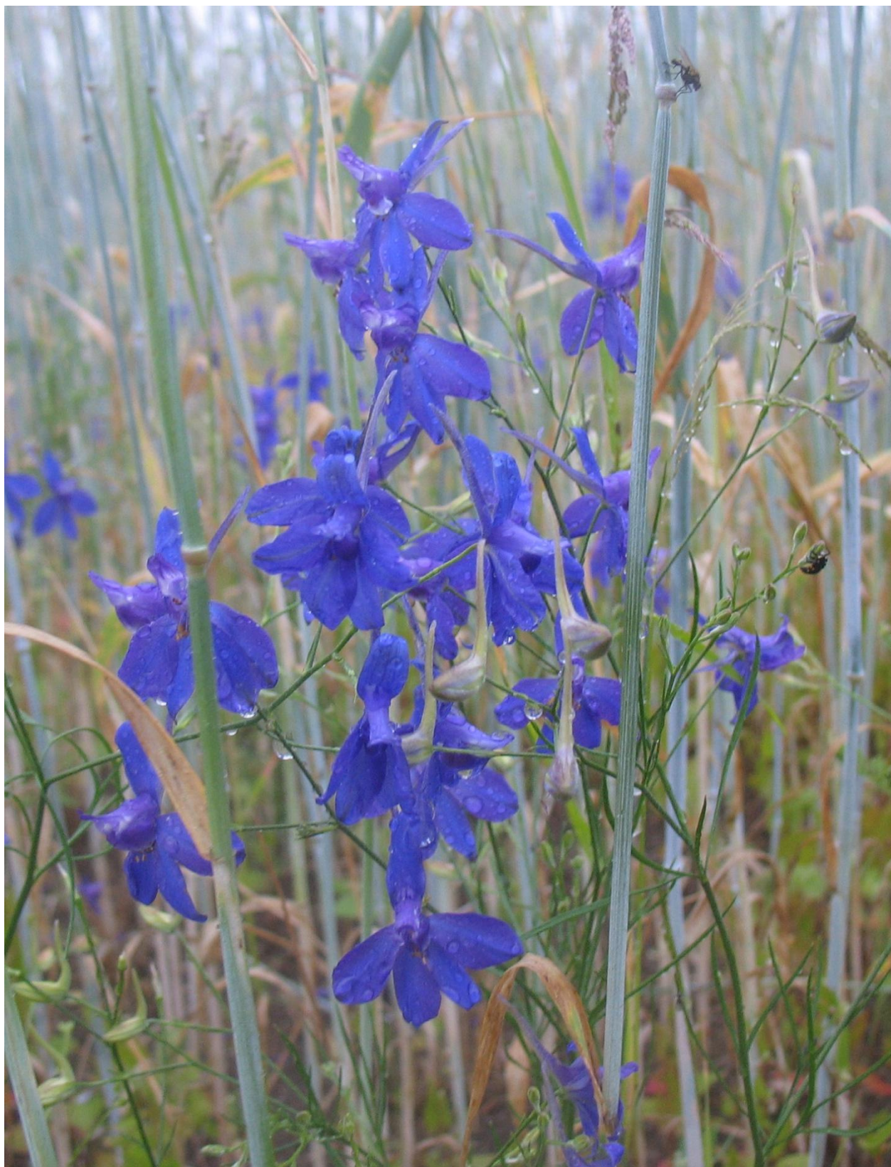
Ett vackert åkerogräs: Riddarsporre vid Lyngsjö