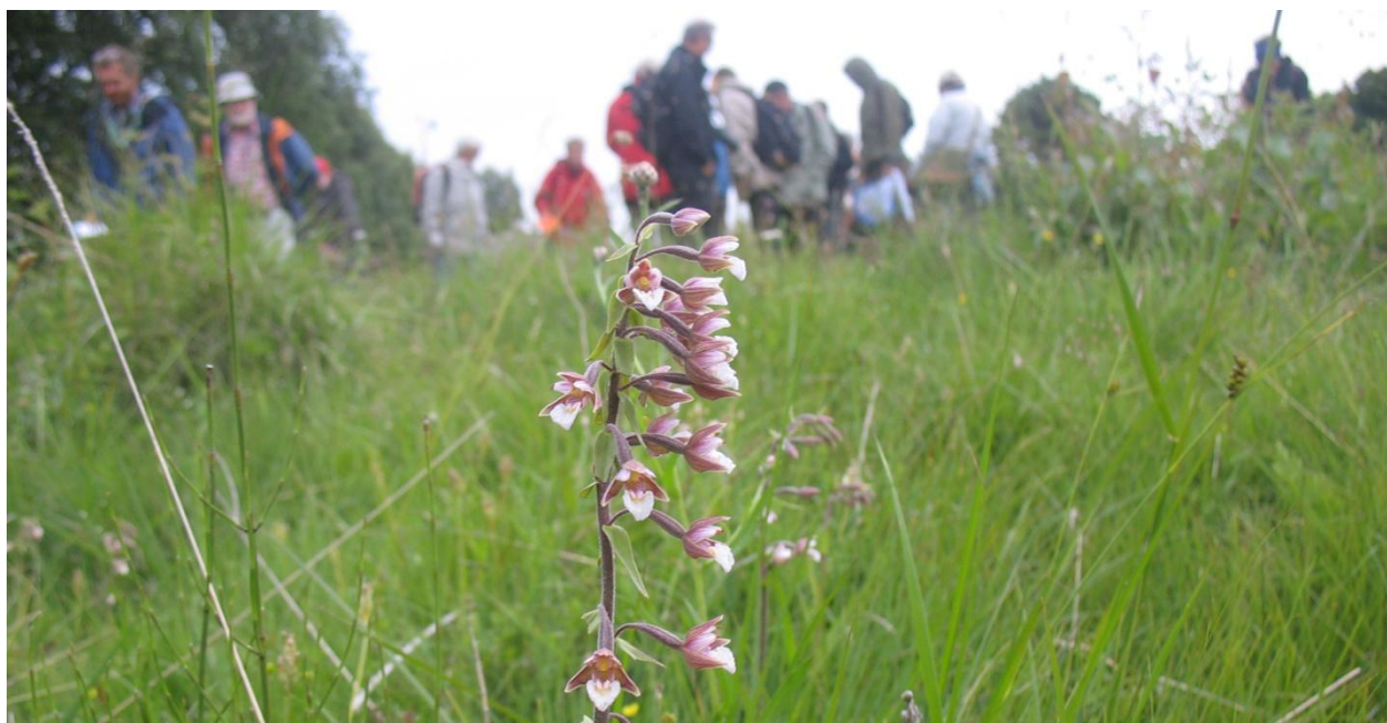
Kärrknipproten blommade rikligt