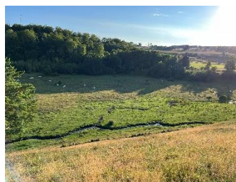
Vacker utsikt från Söndre Backe