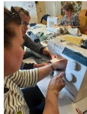
Här lyser flitens lampa på Lappa lagakursen.