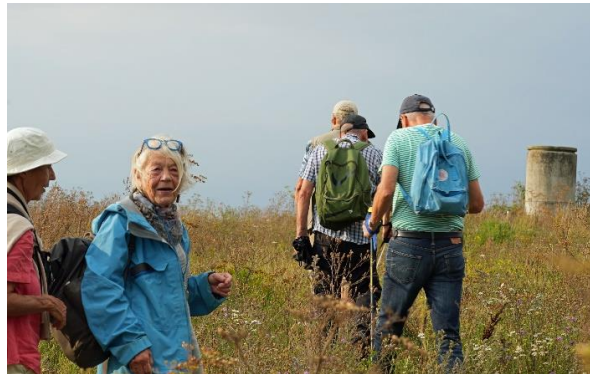
Floravandring Härlövs backar (gamla soptippen).