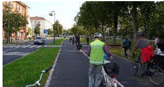
Vi tittade inte bara på det som var problematiskt. Här beundrade vi den nya cykel- och fotgängarvänliga Kanalgatan