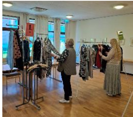
Klädbytardag i HSB-förening.