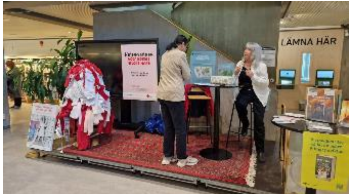
Information om kläders miljöpåverkan och en gissningstävling anordnades på Stadsbiblioteket i Kristianstad.