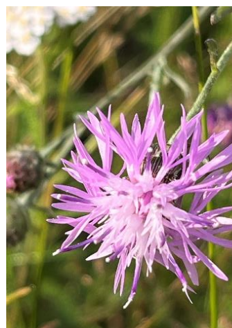
Sandklinten har etablerat sig på Horna Sande.