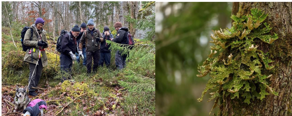
Några av deltagarna samt ett pampigt lunglavexemplar